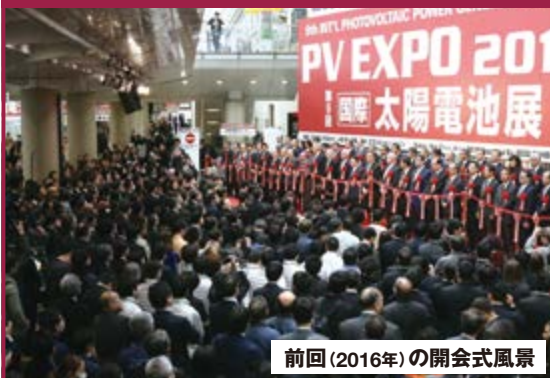
前回(2016年)の開会式風景

参加 歓迎 開会式 初日 9:30~ 3/1(水) エネルギー分野の社長、役員など トップ60名がテープカット!